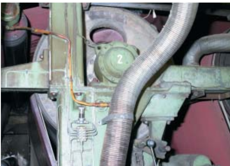
Bild 1: Mannloch eines Trockenzyinders Der Zugang ist durch Stuhlung und Schläuche erschwert, aber noch möglich.

Wir wollen im folgenden auf einen wichtigen Aspekt zum letzten Punkt der vorgenannten Maßnahmen eingehen und im übrigen auf die BG-Regel „Arbeiten in Behältern und engen Räumen“ (BGR 117) verweisen.