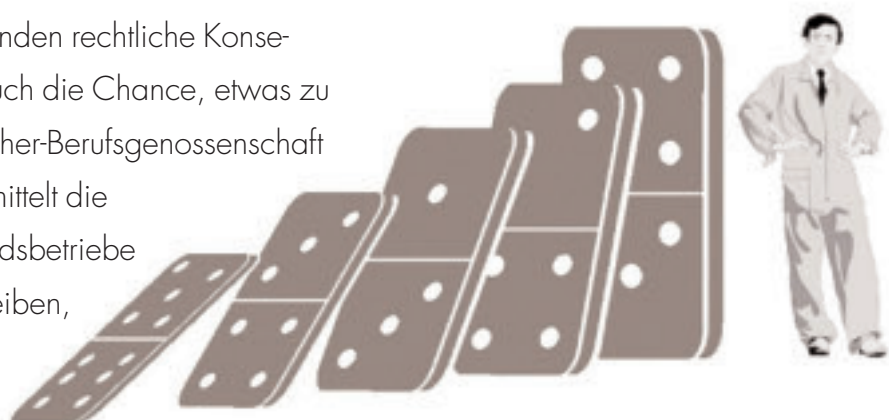
Unfallursachenkette, dargestellt mit Hilfe von Dominosteinen.

Denn, warum erst aus Schaden klug werden, wenn man schon aus Fehlern lernen kann!