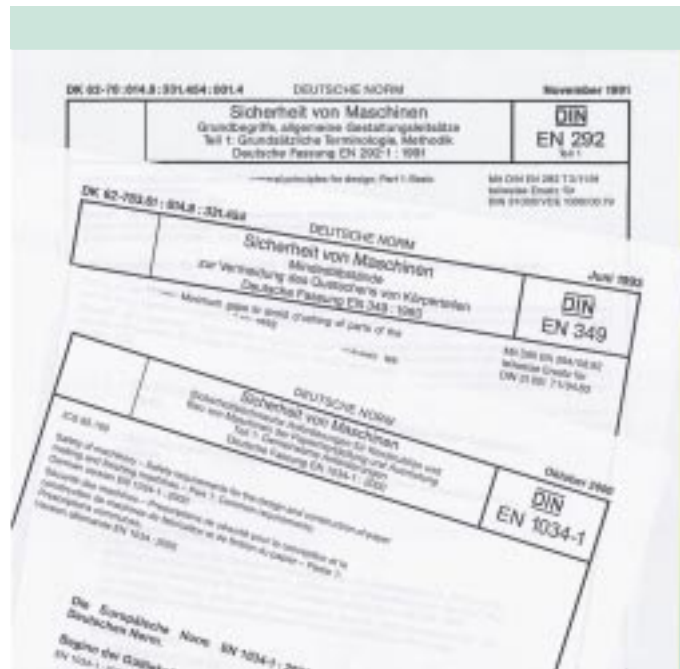
Beispiele für einige harmonisierte europäische Normen zur Maschinensicherheit

Wer die daraus bisher hervorgegangenen Normen DIN EN 1034-1