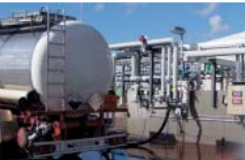
Blick auf die Entladestelle

Noch war kein Tag nach dem Besuch des Technischen Aufsichtsbeamten in einem Mitgliedsbetrieb vergangen, als ihn die Nachricht über einen schwerwiegenden Unfall erreichte. Beim Entladen eines Tankwagens mit 96%-iger Schwefelsäure war der Verbindungsschlauch zwischen dem Tankwagen und dem Umfüllstutzen des Lagertanks nach ca. zehn Minuten des Umfüllens geplatzt. Die Säure hatte sich nicht nur über den Entladeplatz, sondern leider auch über den