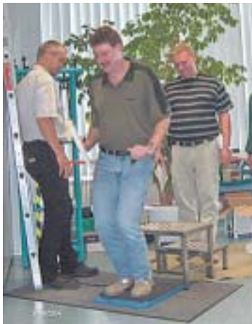
Die unbestechliche Waage zeigte jedem, welche Kräfte beim Sprung aus 40 Zentimetern Höhe auftreten.

Informationen und Unterlagen zu diesem Seminar, wie z. B. ein Muster-