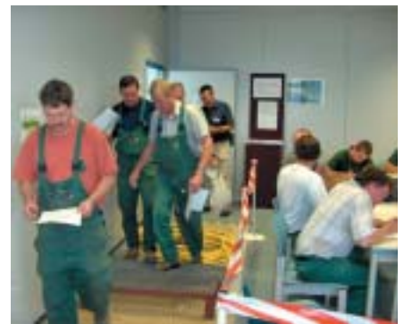
Und los ging's mit dem Überwinden des Stolper-Parcours, ... alle haben sich konzentriert – Unfälle gab es keine.

fragebogen, Bilder und ein kurzer Film über das beschriebene Seminar sowie Folienvorlagen zum Thema, können als CD-ROM von der Papiermacher-Berufsgenossenschaft angefordert werden. Der zuständige technische Aufsichtsbeamte ihres Betriebes wird Sie gerne bei der Durchführung der Seminare unterstützen. Abruf der CD über Herrn Peter Schmitt: Fon/Fax: 06131 785 416/577, e-Mail: schmitt@lpz-bg.de . HE