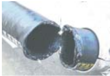
Die defekte Schlauchleitung: Neu, aber leider nicht für den Tankinhalt geeignet

Die Mitarbeiter der Papierfabrik trugen die notwendige persönliche Schutzausrüstung. Ob dies das Ergebnis der Beanstandung des Technischen Aufsichtsbeamten vom Vortag war oder ob der angesprochene Mangel nur eine Ausnahme darstellte, ist dabei nebensächlich. Hauptsache ist, dass beide Mitarbeiter nach einem kurzen Aufenthalt im