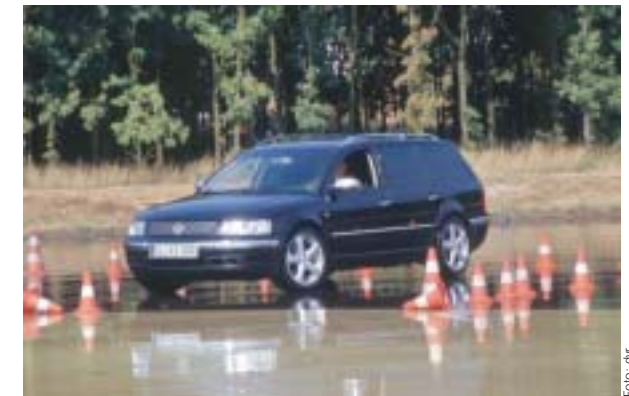
PKW-Sicherheitstraining auf nasser Fahrbahn

Ob zielgruppengerechtes Sicherheitstraining oder Seminare und betriebliche Weiterbildung – Verkehrssicherheit ist Thema bei den Berufsgenossenschaften.